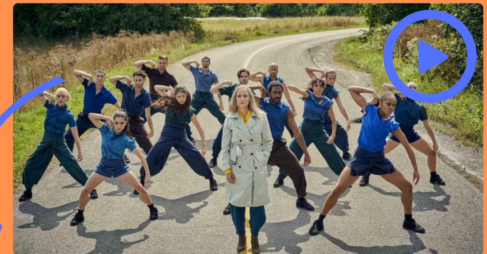
Mélodies perdues de Christian Lalumière (2021) Vidéodanse (moyen métrage) mettant en scène les interprètes de la compagnie Ballets Jazz de Montréal