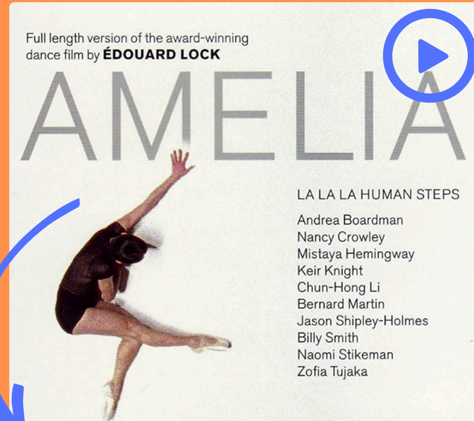
Amelia d'Édouard Lock (2003) Vidéodanse (moyen métrage) mettant en scène les interprètes de la compagnie La la la Human Steps