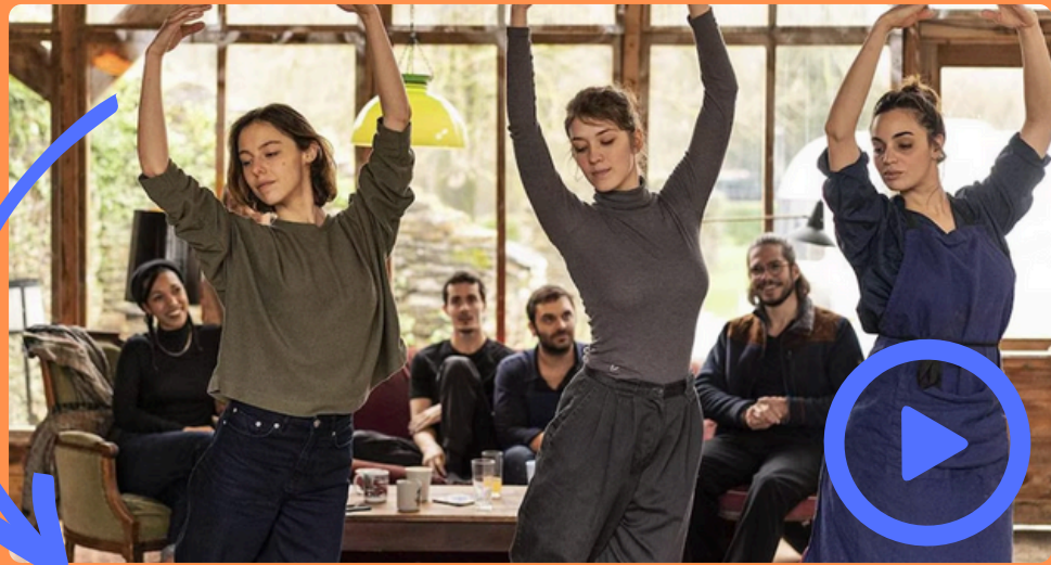
En corps de Cédric Klapisch (2022) Film (long métrage) mettant en vedette l'univers du chorégraphe et interprète Hofesh Shechter